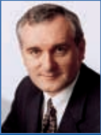
Bertie Ahern, TD Taoiseach (Premier ministre)

Je vous souhaite la bienvenue dans les bâtiments du gouvernement, édifice de caractère de la capitale et siège du gouvernement irlandais. Le bâtiment est un exemple remarquable de l'architecture publique du début du 20 e siècle, magnifiquement aménagé par l'Office des travaux publics pour y loger mon ministère.